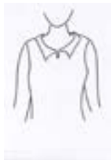
SI Escote alto