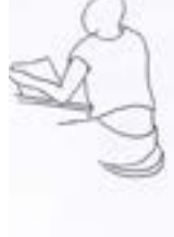
NO Pantalones flojos