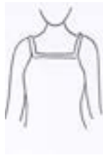
NO Tirantes muy delgados