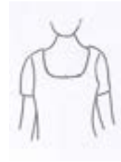
NO Escote bajo