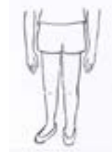
NO Faldas/short cortas