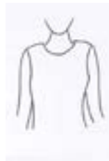
SI Blusa cubre los hombros

*Hemos dado estos ejemplos para ayudarles a entender los reglamentos. Sin embargo, estos ejemplos no son los únicos. Si los padres/apoderados no están seguros si el artículo de ropa es apropiada, por favor, llamen a la escuela y hablen con uno de los administradores. Es importante tener esta lista en mente cuando compren ropa para la escuela. La Administración de Columbus Middle School tiene la autoridad según la decisión del Consejo de Columbus Public Schools de usar su discreción en los casos del código de vestir. Los Administradores de Columbus Middle School harán la decisión si un artículo de ropa es apropiado o no.